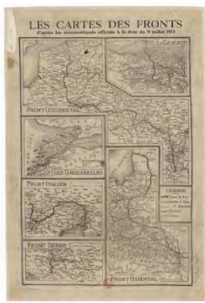
Les cartes des fronts, d'après les communiqués officiels à la date du 9 juillet 1915 Éditeur : [s.n.] Date d'édition : 1915 Document cartographique, 37 x 56 cm