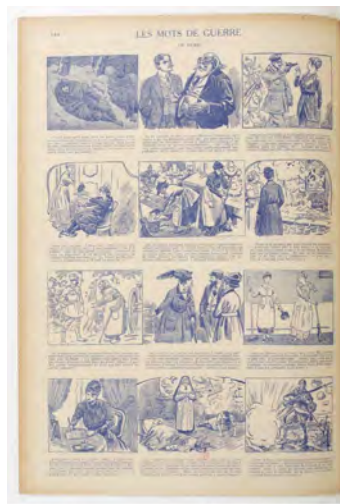
L'Histoire de la Grande guerre : la Guerre en Images vécue et racontée au jour le jour : récits de combats... Éditeur : [s.n.] (Paris) Date d'édition : 1928 Bandes dessinées historiques, 1 vol., 188 p. : in-4