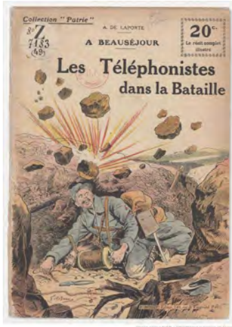
A Beauséjour: les téléphonistes dans la bataille. de A. Laporte, (18.-19..), romancier Editeur: F. Rouff (Paris) monographie imprimée Date d'édition : 1918