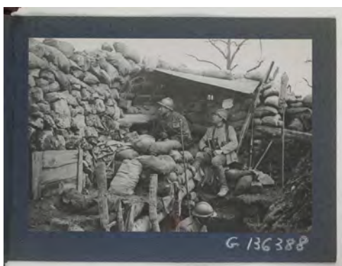
Scènes du front, Champagne et Balkans Date d'édition : 1914-1918 Album de 24 photographies argentiques ; 11,5 x 16,5 (vol.)