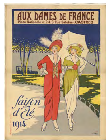
Aux Dames de France, place nationale et 2, 4, 6 rue Sabatier - Castres : saison d'été 1914 A. Mahn, (18..-19..) affichiste, illustrateur Éditeur : [s.n.] Imp. Chaix (Paris) Date d'édition : 1914 Lithographie, coul. ; 160 x 120 cm