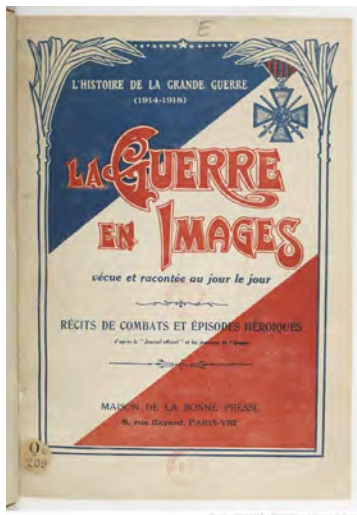
L'Histoire de la Grande guerre : la Guerre en Images vécue et racontée au jour le jour : récits de combats... Éditeur : [s.n.] (Paris) Date d'édition : 1928 Bandes dessinées historiques, 1 vol., 188 p. : in-4