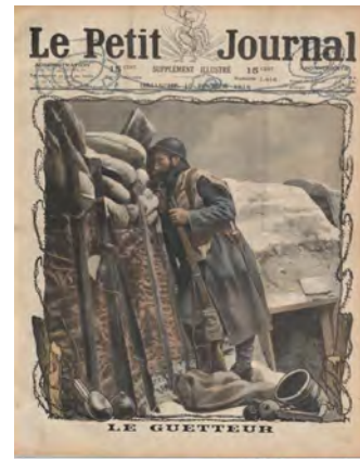
Le Petit journal. Supplément du dimanche Éditeur : [s.n.] (Paris) Date d'édition : 1884-1920 Texte, publication en série imprimée