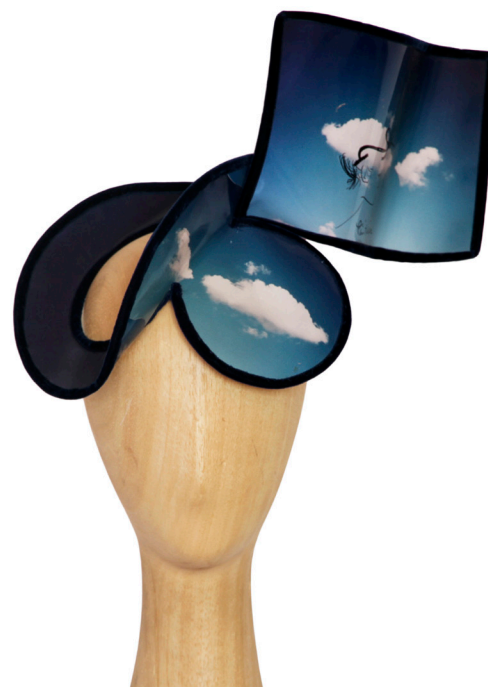
Assemblage géométrique d'inspiration surréaliste. Création portée pour une exposition au magasin du Printemps, octobre 2000.

réci-proque indispensable, qui consiste comme par magie à révéler l'image d'un visage. Il insiste tout particulièrement sur le regard qui contribue au dialogue instauré entre la cliente et le modiste.