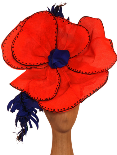
Fleur au cœur en toile bleu roi et pétales en canevas rouge vermillon. Prix de Diane, vers 1993/1995