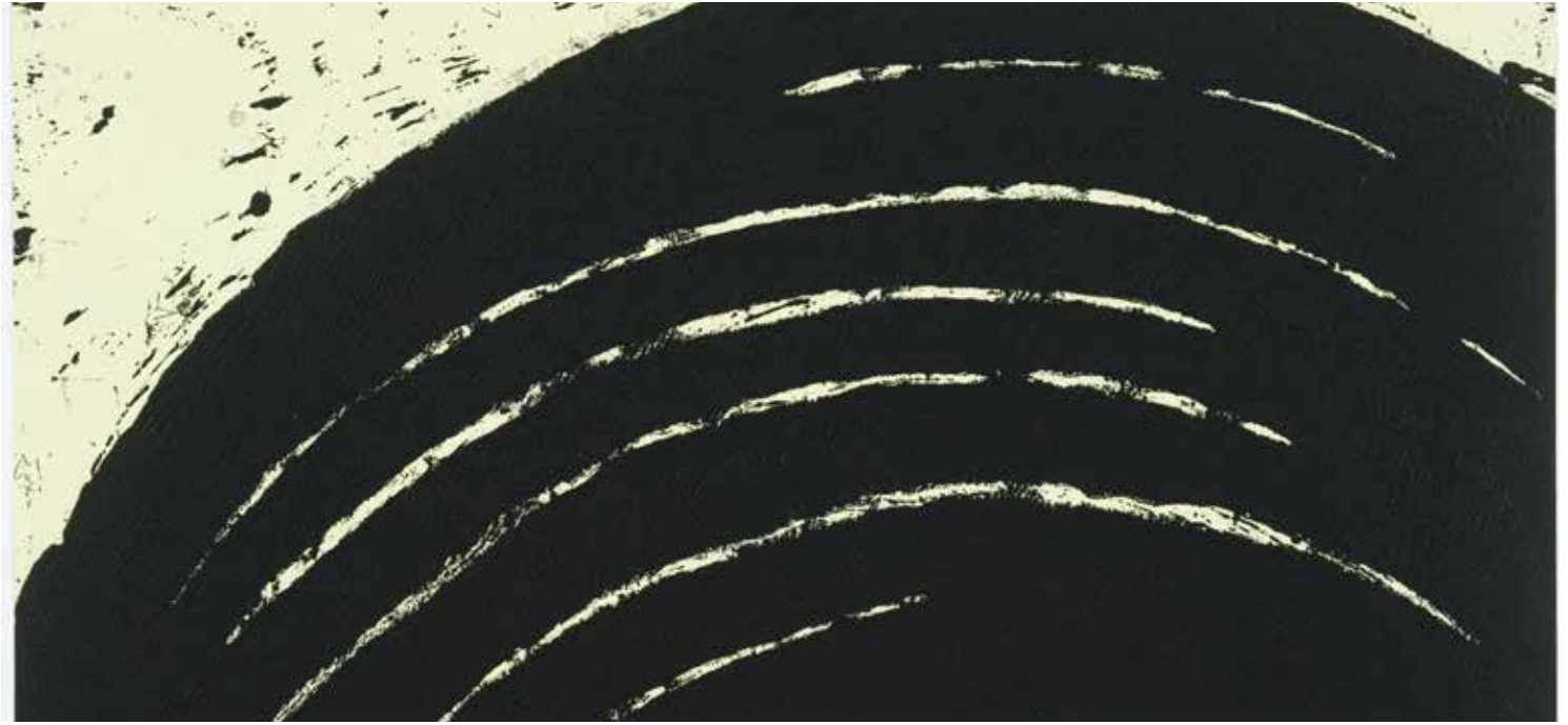
Richard Serra, Path and Edges 3 , 2007, gravure, 65,4 x 99 cm

Enfin, en regard des dessins anciens présentés dans « La Fabrique de l'œuvre », le musée des Beaux-Arts invite l' artothèque à investir deux espaces du parcours permanent du musée (galerie d'actualités et cabinet d'arts graphiques) sous la forme d'une carte blanche intitulée « Intentions graphiques », qui dévoilera les intentions du dessin contemporain à travers 15 œuvres récentes de 15 artistes présents dans la collection de l'artothèque.