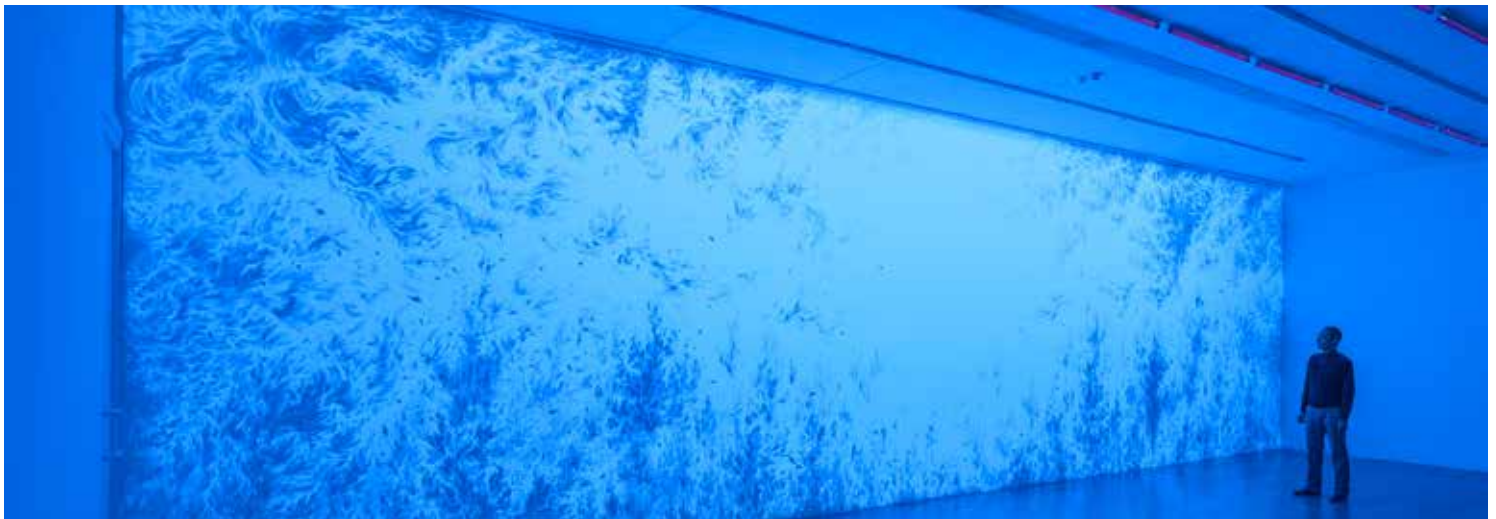
Eric Winarto, Blacklight Selva , 2013, acrylique sur mur, lumière noire, 380 x 1430 cm, Halle Nord Genève

Un contrepoint contemporain sera proposé à l'entrée de l'exposition, sous la forme d'une commande passée à l'artiste malaisien Eric Winarto invité en résidence par la Ville d'Angers, qui créera spécialement pour l'exposition une œuvre in situ et éphémère. Puisant son inspiration dans les œuvres des maîtres exposés, et notamment dans leurs paysages, la proposition de l'artiste reliera ainsi étroitement dessins anciens et contemporains . Son axe de recherche vise l' expérience totale, artistique et physique, philosophique et spirituelle .