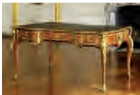
Bureau plat du Dauphin, fils de Louis XV, à Versailles

Légendes et crédits des visuels libres de droits pour la presse