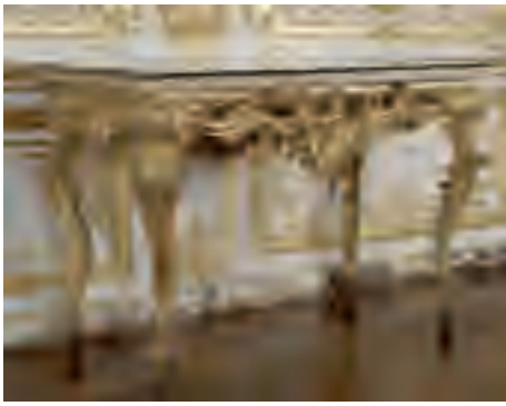
Table des Chasses, à plateau de stuc avec le plan de Compiègne.

François Roumier (sculpteur), Gaspard-Marc Bardou (doreur), Joseph Ducy (géographe), 1737, chêne sculpté et doré, plateau de stuc, château de Versailles.