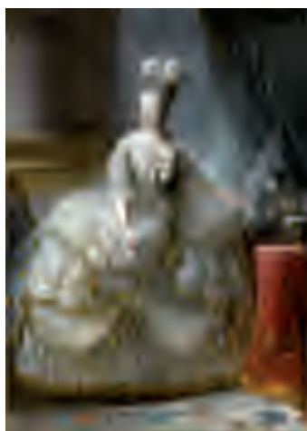
Marie-Antoinette d'Autriche, reine de France Elisabeth Vigée-Lebrun (1755-1842) 1779-1788

Légendes et crédits des visuels libres de droits pour la presse