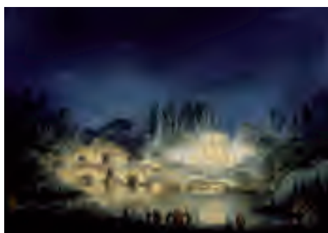
Illumination du Belvédère du Petit Trianon, 1781 Claude-Louis Châtelet (1753-1794). 1781

Versailles, musée national des châteaux de Versailles et de Trianon.