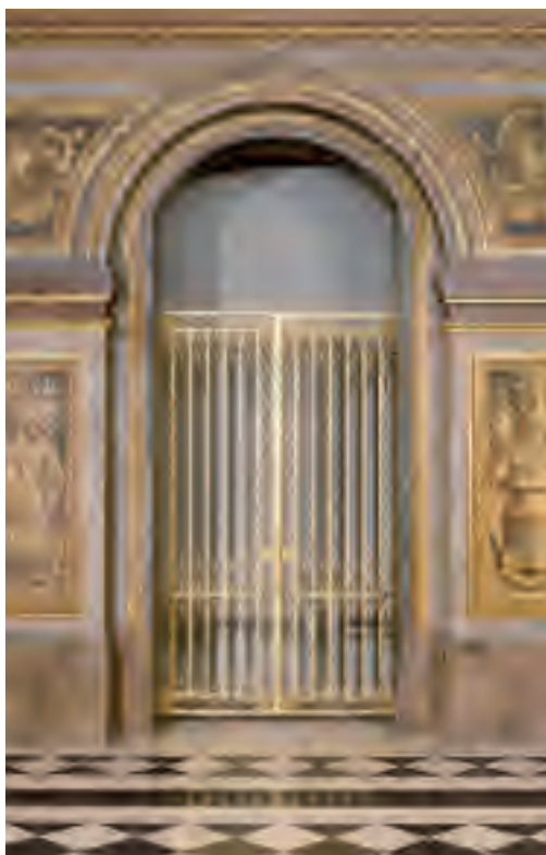
Grille de la salle des Hoquetons

Légendes et crédits des visuels libres de droits pour la presse