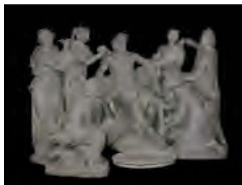
Apollon servi par les nymphes

Chêne, marqueterie d'amarante, bois satiné, bois de violette, bronze doré, cuir, Versailles, musée national des châteaux de Versailles et de Trianon