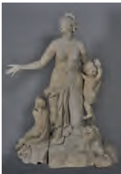
Latone et ses enfants

Marbre. Versailles, musée national des châteaux de Versailles et de Trianon