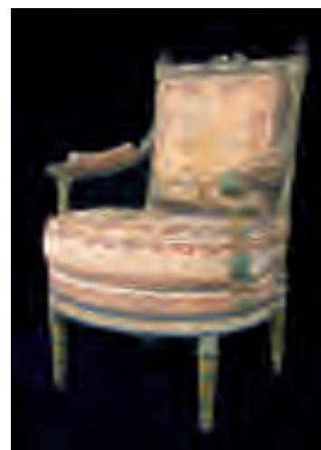
Fauteuil de Marie-Antoinette, mobilier « aux épis » Georges 1er Jacob, 1787

Versailles. Musée national des châteaux de Versailles et de Trianon.