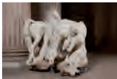
Chevaux du soleil s'abreuvant

Groupe, marbre. Versailles, musée national des châteaux de Versailles et de Trianon © Château de Versailles. Dist. RMN / © Jean-Marc Manai.