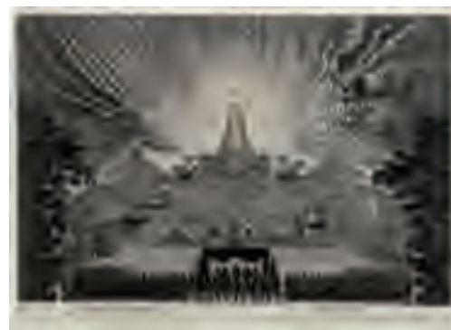
Fête de 1674, cinquième jour- née : feu d'artifice sur le canal de Versailles

Huiles sur toile. Versailles, musée national des châteaux de Versailles et de Trianon