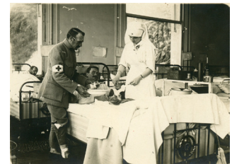
Hôpital auxiliaire n°37, Avrillé (Maine-et-Loire), 1914-1918