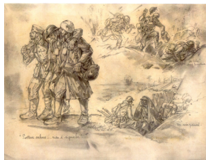
« Secteur calme...rien à signaler »..., 1917, par Marcel Santi, Dessin au crayon