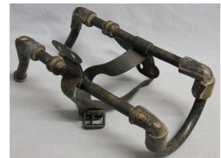
Atèle © Mémorial de Verdun