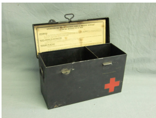
Boîte médicale