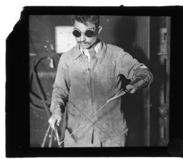
Ancien combattant amputé de son bras gauche remplacé par une prothèse