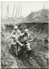
Blessé secouru aux Eparges sur le champ de bataille

L'exposition, présentée au 2 e étage du Mémorial est accessible aux mêmes heures d'ouverture que le musée.