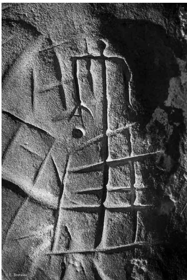
5. Fontainebleau (Seine-et-Marne) « Le Mont Aiveu », abri sous roche Personnage tridactyle et quadrillages.