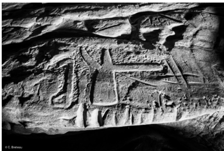
6. Buthiers (Seine-et-Marne) « La Vallée aux Noirs », la Grotte à la Hache Hache polie emmanchée et probable croc obtenues par piquetage. Elles représentent des objets réels datant du Néolithique, et plus précisément du V e ou du début du IV e millénaire avant J.-C.