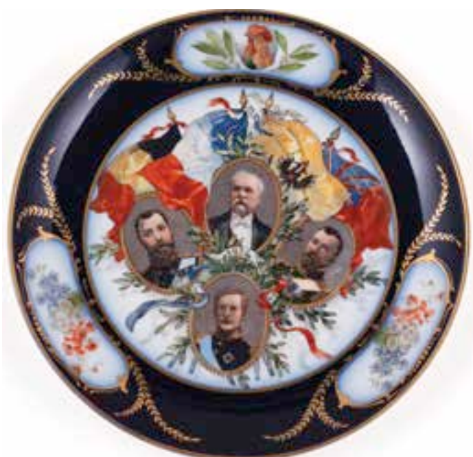
10. Assiette décorative (1914 – 1918)

L'exposition Et 1917 devient Révolution , soutenue par le Département des Hauts-de-Seine (prêt des Archives départementales émanant de la Bibliothèque d'histoire sociale-La Souvarine), illustre la volonté de la collectivité de permettre au plus grand nombre d'accéder facilement à un patrimoine culturel et historique exceptionnel.