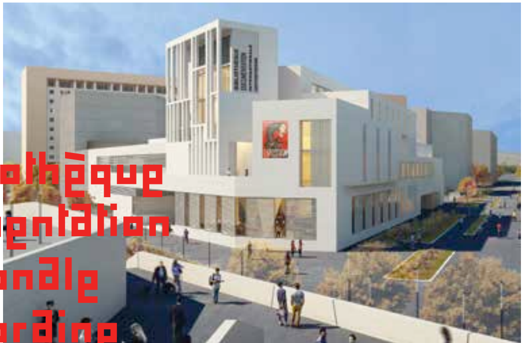
Le projet de l'Atelier Bruno Gaudin. Vue du cours Nicole Dreyfus.