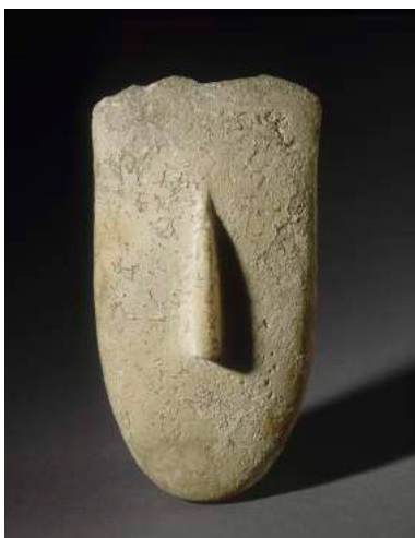
↑ Tête d'une idole cycladique du groupe de Spédos, 3200-2800 av. J.-C., Paris, musée du Louvre