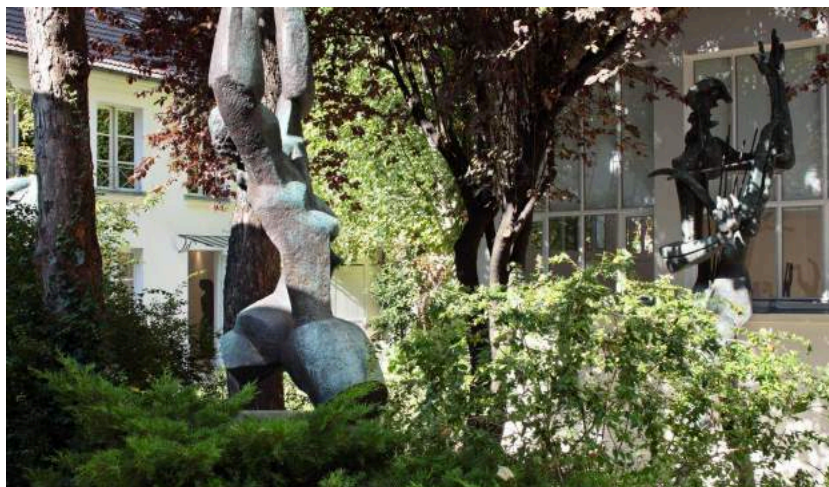
© ADAGP, Musée Zadkine / Photo : Benoit Fougeirol

Dédié à la mémoire et à l'œuvre du sculpteur d'origine russe Ossip Zadkine (1890-1967), qui vécut et travailla dans la maison et les ateliers qui l'abritent, de 1928 à 1967, ce lieu a été inauguré en 1982. Il a été créé grâce au legs consenti par Valentine Prax, veuve du sculpteur, elle-même artiste peintre, à la Ville de Paris, instituée légataire universelle de ses biens. A l'occasion de ses trente ans, devenu – au terme d'une année de travaux – accessible à tous, le musée atelier rénové a ouvert ses portes, doté d'un nouvel espace d'accueil et riche d'une présentation inédite de ses collections.