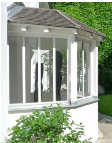
© ADAGP, Musée Zadkine Photo : Vincent Fauvel