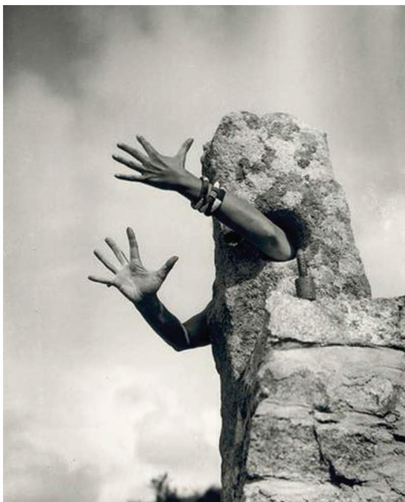
← Claude Cahun, Autoportrait , 1933, tirage argentique d'époque, collection Dolorès Alvarez de Toledo, Paris © Estate Claude Cahun / DR

VERNISSAGE PRESSE : JEUDI 28 SEPTEMBRE 9H30-13H00