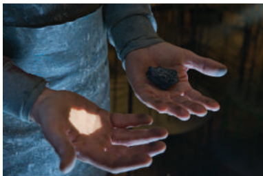
↑ Oscar Santillan, The Enemy , 2015, photographie, 100x150 cm © Oscar Santillan