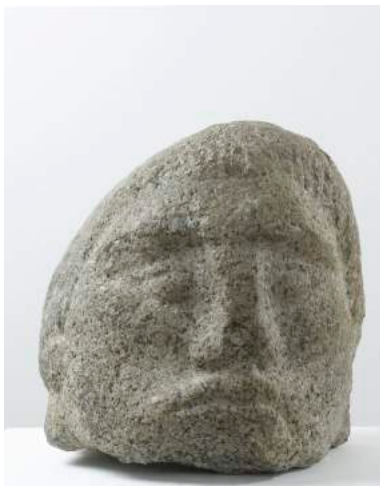
↑ Ossip Zadkine, Tête héroïque , 1908, granit, 29 x 27 x 28 cm © Musée Zadkine/ Roger Viollet © ADAGP, Paris 2017