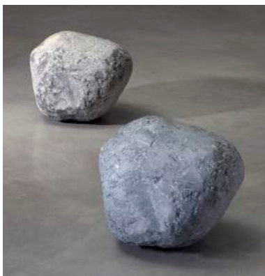
↑ Giuseppe Penone, Être fleuve 5 , 1998, 40 x 40 x 50 cm, musée de Grenoble, achat à l'artiste en 2011 © ADAGP, Paris 2017