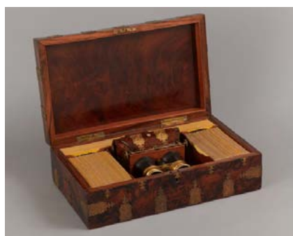
The Exhibition Opera Stereoscope. London Stereoscopic and Photographic Company.