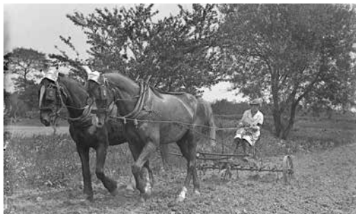
Women's Land Army, Travail de la terre avec un couple de chevaux.

La couverture de l'Abécédaire 14-18 (H&G 427) mérite un détour, avec l'aide du web. Commons reproduit la photo et en indique la source : Lectures pour tous du 15 juillet 1917. Gallica a scanné le magazine qui peut être intégralement consulté en ligne. http://clioweb.canalblog.com/tag/3femmes