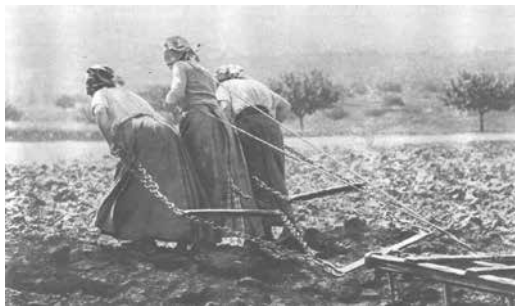
3 robustes paysannes, Lectures pour tous 1917