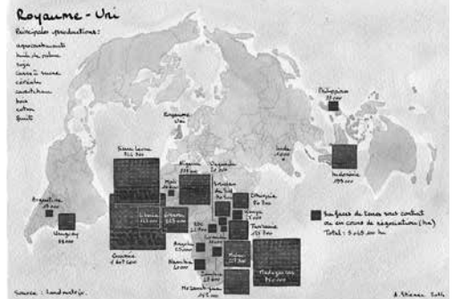
Agnès Stienne, Terres arables acquises par des entreprises britanniques (5 M ha) http://visionscarto.net/accaparement-des-terres

http://clioweb.canalblog.com/tag/defenseurspaix