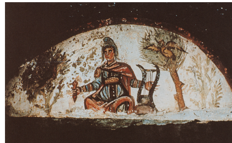
Orphée, fresque dans les catacombes des saints Marcellin et Pierre à Rome