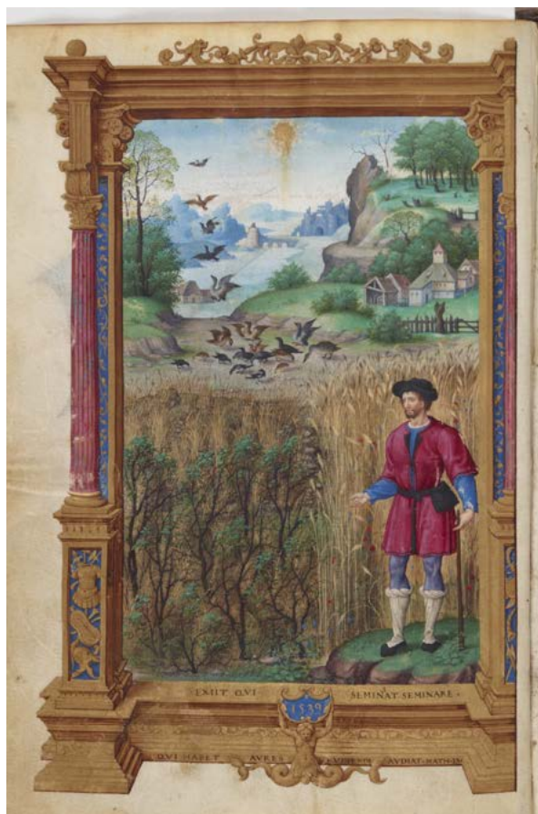
Paraphrase d'Erasmus sur l'Évangile de Saint-Matthieu (BNF, Mss., Français 934)

Tout au long du parcours de l'exposition, les visiteurs pourront admirer nombre de chefs-d'œuvre rarement présentés au public en raison de leur fragilité et de leur préciosité. C'est du reste la première fois que l'on tente de reconstituer la bibliothèque de François I er de façon aussi ambitieuse. Beaucoup de volumes reviendront pour la première fois au château royal Blois depuis le XVI ème siècle, ce qui ne manquera pas de susciter l'intérêt. Entre autres pièces exceptionnelles seront présentés les célèbres Grandes heures d'Anne de Bretagne enluminées par Jean Bourdichon ; les Heures de Louis de Laval enluminées par Jean Colombe, considérées comme le manuscrit le plus enluminé au monde avec près de 1200 miniatures ; une des vingt reliures brodées de la Renaissance encore conservées au monde ; la Bible de Robert Estienne, imprimée en 1540, et dotée d'une très précieuse reliure marquée du F royal ; ou des Évangiles carolingiens, datant du IX ème siècle mais reliés par la suite pour François I er .