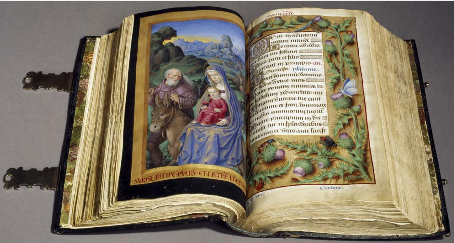
Grandes Heures d'Anne de Bretagne (BNF, Mss., Latin 9474)

En 2015, la France célébrera les 500 ans de l'accession au trône de François I er ainsi que l'anniversaire de la bataille de Marignan. Des manifestations, dont plusieurs expositions de grande envergure, sont prévues tout au long de l'année.