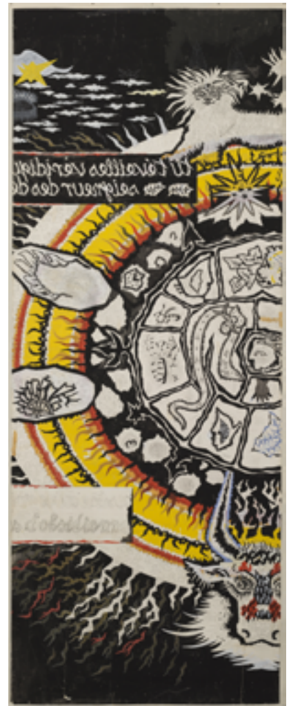
Jean Lurçat Ornamentos sagrados , (carton, détail), 1966, 7 lés de 4,40x1,50 m chacun, atelier Tabard, Aubusson.

L'exposition temporaire au musée des Beaux-Arts se déclinera en trois parties . Le parcours commencera par le choc esthétique majeur de la vie de Jean Lurçat , à savoir sa découverte de la tapisserie de L'Apocalypse d'Angers, en 1938, alors qu'elle était en partie exposée dans le palais épiscopal. Pour enrichir cette première partie, une présentation de l'histoire de la genèse de l'iconographie de l'Apocalypse au Moyen Âge sera proposée au public. Des objets d'art médiévaux (peintures, ivoires, manuscrits) seront confrontés aux œuvres de Lurçat des années 1930. Le deuxième temps du parcours de l'exposition sera consacré à la première interprétation, littérale, de l'Apocalypse par Lurçat : la tapisserie d'Assy . Enfin, le dernier espace se concentrera sur Le Chant du monde , par la présentation de ses cartons . Il s'agira de montrer au public combien cette œuvre ultime, inachevée, constitue la table des matières de l'existence de Lurçat, et combien elle renvoie à la tapisserie médiévale du château .