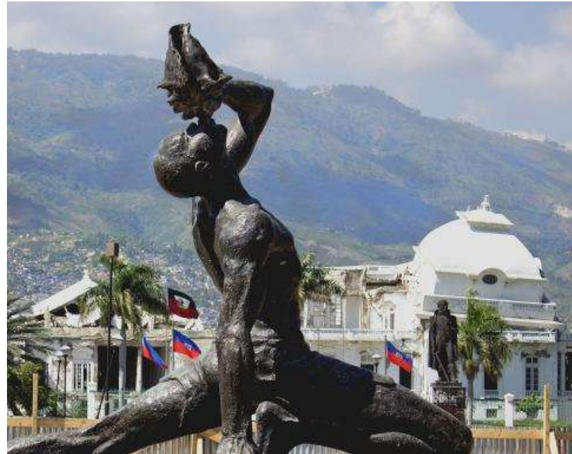
La statue du marron inconnu à Port-au-Prince (Haïti) inaugurée en 1968, sous le régime Duvalier.