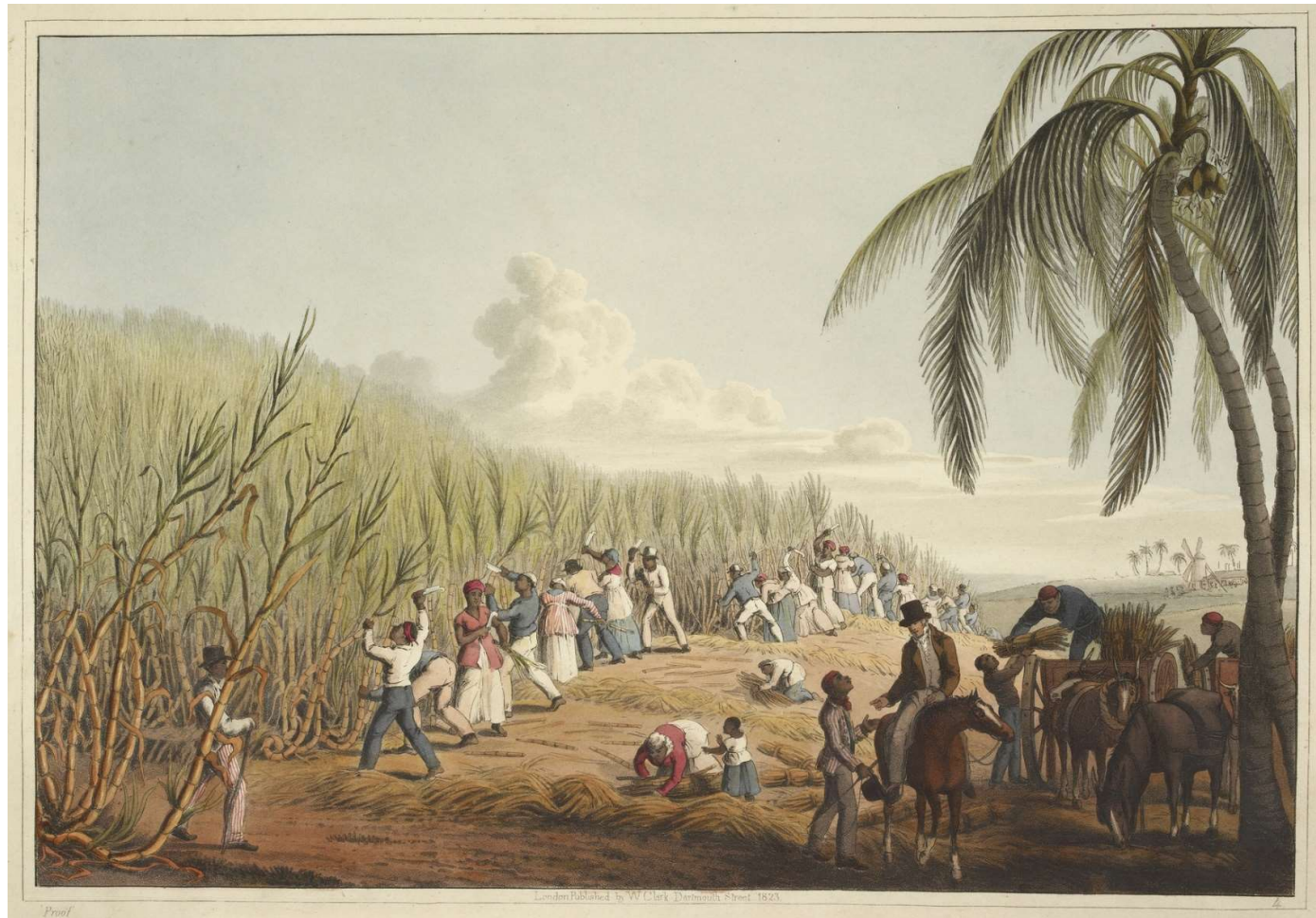
Source : William Clark, Ten Views in the Island of Antigua, in Which are Represented the Process of Sugar Making.... From Drawings Made by William Clark, During a Residence of Three Years in the West Indies (London, 1823). Esclaves coupant la canne (eurescl.eu)