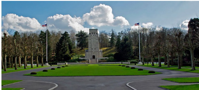
Cimetière militaire américain Aisne-Marne Belleau

↳ Les cimetières américains par David Atkinson , Surintendant à la nécropole américaine du Bois de Belleau dans l'Aisne (ABMC, American Battle Monuments Commission)