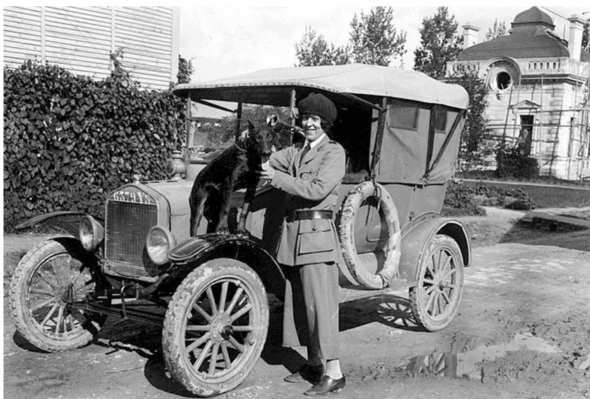
Anne Morgan au Château de Blérancourt © aisne14-18.com

© Archives départementales du Nord (Référence de l'image : Musée 422 / 4 FI 30-2789)