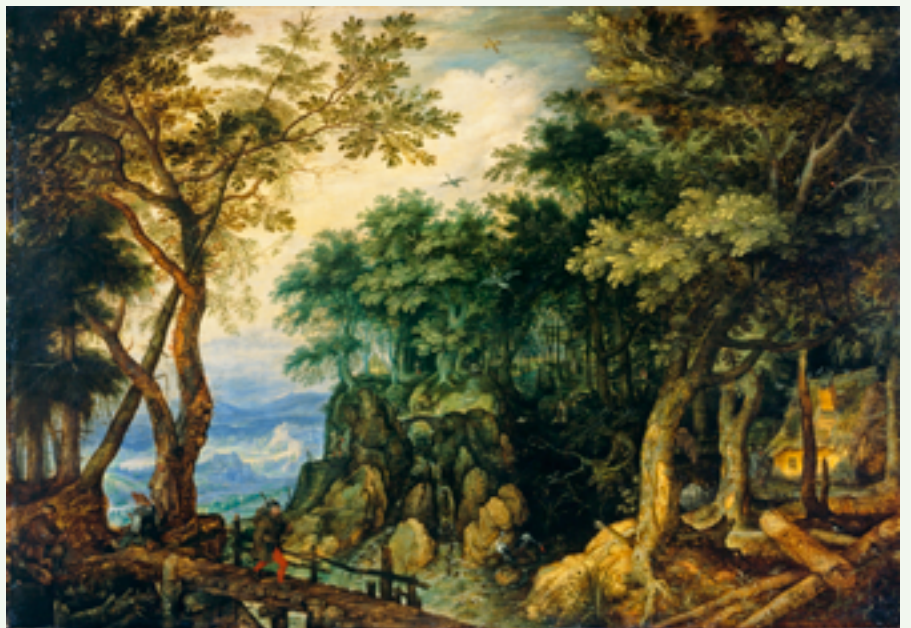
Roelant Savery, Paysage de montagne , © Genève, Musée d'art et d'histoire photo : Bettina Jacot Descombes