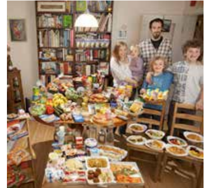
extrait du livre Hungry Planet.