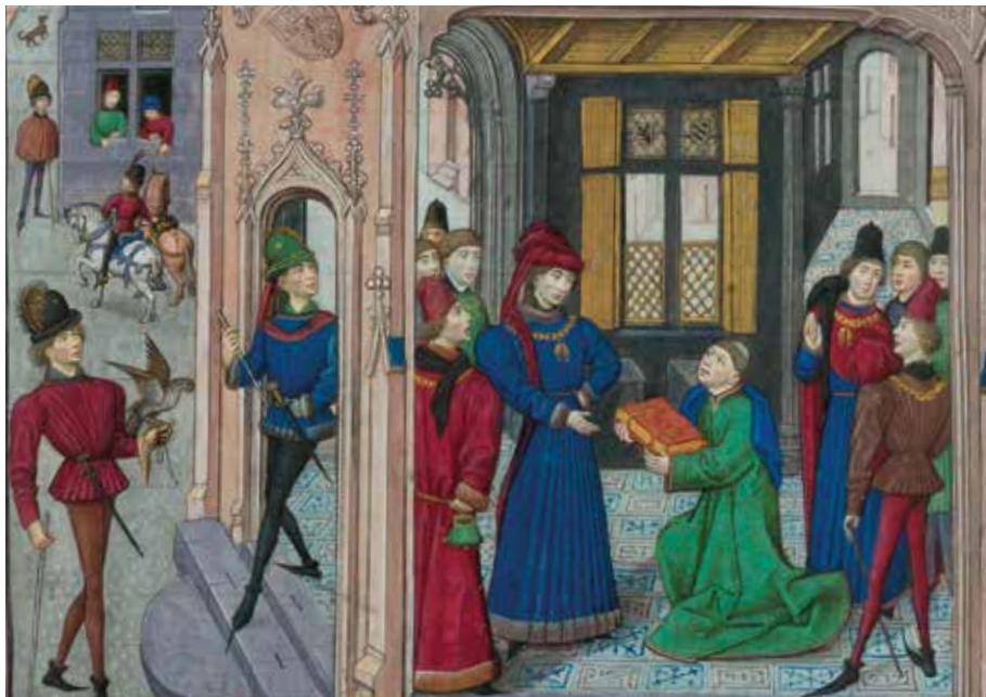
Jean Wauquelin, Les Faicts et conquestes d'Alexandre le Grand , Scène de dédicace (au duc de Bourgogne Philippe le Bon ?), Bruges, avant 1467, Paris

L'exposition se terminera en abordant la pérennité de l'enluminure après l'invention de l'imprimerie à caractères mobiles en 1455 par Gutenberg. Alors que triomphait une esthétique du décor gravé en noir et blanc, un durable attachement pour les enluminures suscita une mise en couleur, soit par un simple lavis, soit par un traitement pictural plus couvrant, des gravures. Des peintres de renom continuèrent également à exploiter les espaces réservés par l'imprimeur, pour la décoration d'ouvrages destinés à une clientèle de marque, toujours attachée aux enluminures.