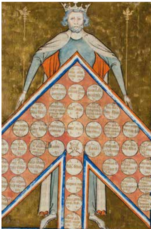
Grand Coutumier de Normandie, Normandie, vers 1350-1360, Paris, Petit Palais