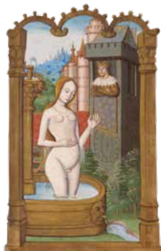
Livre d'heures , Bethsabée surprise au bain par le roi David , Rouen, début du 16 e siècle, ancienne collection Louis Deglatigny, Caen, collection privée