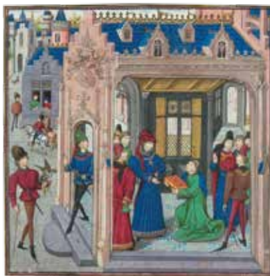
Jean Wauquelin, Les Faicts et conquestes d'Alexandre le Grand , Scène de dédicace (au duc de Bourgogne Philippe le Bon ?), Bruges, avant 1467, Paris