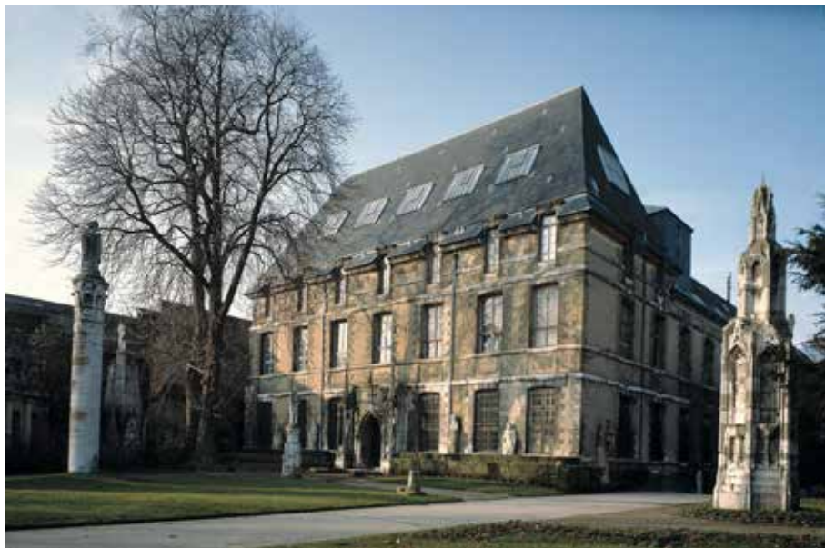
Musée des Antiquités