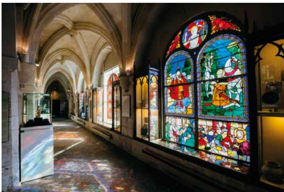
Musée des Antiquités

Intégré depuis janvier 2016 à la Réunion des Musées Métropolitains de Rouen Métropole, le musée des Antiquités fit, dès son ouverture en 1834, la part belle aux œuvres du Moyen Âge et de la Renaissance, et son intérêt précoce pour les œuvres de ces époques confirme cet établissement comme un lieu de première importance pour l'histoire des musées européens. Certainement l'un des plus riches musées de Normandie en chefs-d'œuvre médiévaux et Renaissance, le musée des Antiquités apparaît comme tout désigné pour réunir, le temps d'une exposition, les trésors enlumines de cette région. Les visiteurs pourront également découvrir dans les collections permanentes des œuvres de référence tant pour la seule Normandie que pour la France : vase mérovingien de Douvrend, cristal carolingien du Tombeau de saint Remi à Reims, croix reliquaire orfèvrée provenant de l'abbaye du Valasse, ivoires médiévaux, émaux limousins, chapiteaux de Saint-Georges de Boscherville ou de Saint-Denis, tapisserie des Cerfs ailés ou encore tapisserie du château d'Anet, sans oublier un ensemble important de vitraux (Notre-Dame de Bondeville, Sainte-Chapelle de Paris, cathédrale Notre-Dame de Rouen...).