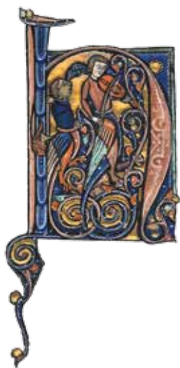
Bible de Foucarmont, Neufchâtel-en-Bray, musée Mathon- Durand

L'omniprésence de la religion chrétienne ne saurait faire oublier que pratiquement tous les domaines du savoir disponible étaient repris dans les livres. L'illustration didactique développa principalement ses exposés théoriques dans le livre enluminé. Compilation de textes normands relatifs à l'organisation judiciaire, la Coutume de Normandie était parfois complétée par le Traité de l'arbre de consanguinité , accompagné d'illustrations didactiques prenant la forme de tableaux de parenté. Fixé en langue vernaculaire au 12 e siècle, le Roman d'Alexandre , matière chevaleresque d'inspiration antique, fut redécouverte par Jean Wauquelin, qui composa, peu avant 1447, pour Jean de Bourgogne, comte d'Étampes, le Livre des Conquêtes d'Alexandre . Ce texte est notamment connu pour l'exemplarité de la collection Dutuit, riche de plus de deux cents miniatures en un seul volume. Les traités de cynégétique de la fin du Moyen Âge ne seront pas sans suggérer, dans une veine courtoise et princière, les sommes d'histoire naturelle. Le succès du Livre de la Chasse de Gaston Fébus, rédigé à la fin des années 1380, fut tel qu'il sera par exemple adapté à la fin du 15 e siècle pour le gentilhomme normand Louis de Gouvys.