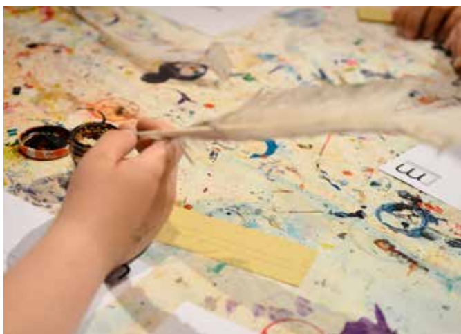
Atelier Musée des Antiquités

Tarif : 3 € + droit d'entrée à l'exposition (4 euros)