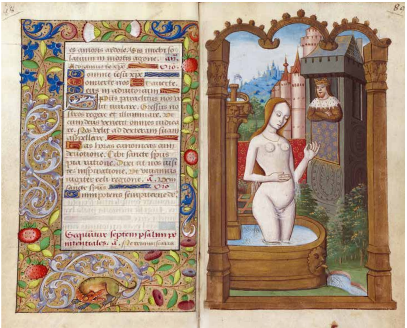
Ci-dessus : Livre d'heures, Bathsabée surprise au bain par le roi David , Rouen, début du 16 e siècle, ancienne collection Louis Deglatigny, Caen, collection privée