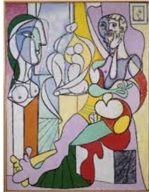
Le Sculpteur, Pablo Picasso, 1931, datation en 1979