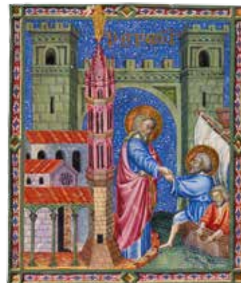
Atelier de Matteo di Ser Cambio, Vocation de saint Pierre et de saint André , Pérouse, après 1377, Rouen, Musée des Beaux-Arts