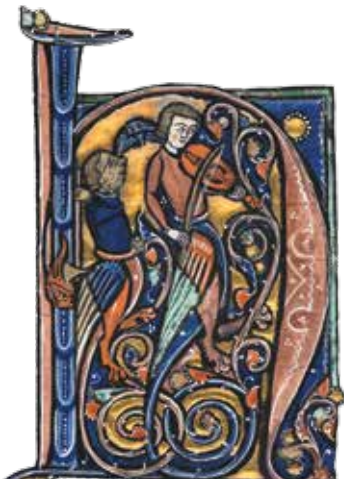
Bible de Foucarmont, Le Mans (?), 1260-1270, Neufchâtel-en-Bray, musée Mathon-Durand