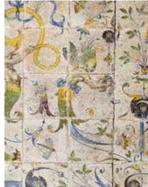
Marche d'autel de la Bâtie d'Urfé, 1557 (détail), musée du Louvre, OA 2518