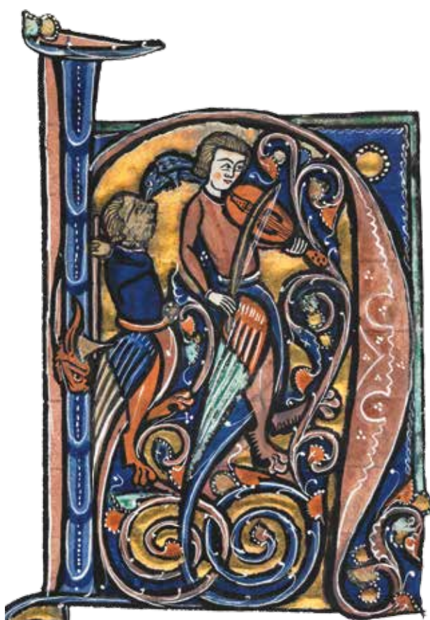
Bible de Foucarmont, Le Mans (?), 1260-1270, Neufchâtel-en-Bray, musée Mathon-Durand