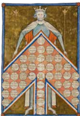
Grand Coutumier de Normandie, Normandie, vers 1350-1360, Paris, Petit Palais (détail)