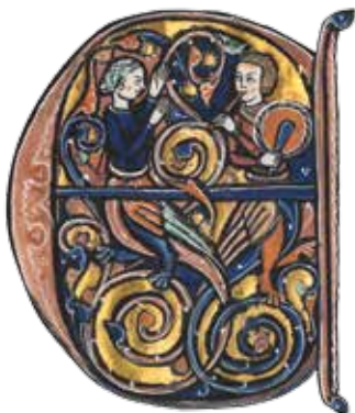
Bible de Foucarmont, Le Mans (?), 1260-1270, Neufchâtel-en-Bray, musée Mathon-Durand