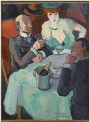
Marguerite de la nuit, Pierre de Belay, 1935