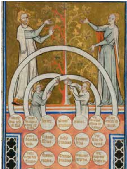
Grand Coutumier de Normandie, Normandie, vers 1350-1360, Paris, Petit Palais

Employé au département des Manuscrits de la Bibliothèque nationale, pour finalement être promu à la tête de cette institution, le normand Léopold Delisle, spécialiste des textes et manuscrits anciens, contribua à la fin du 19 e siècle et au début du siècle suivant, à la redécouverte de plusieurs maîtres de l'enluminure, à l'instar de Maître Honoré - redécouvert grâce à une mention repêchée dans le Décret de Gratien, exceptionnellement prêté par la bibliothèque municipale de Tours - Jean Pucelle ou encore les célèbres frères de Limbourg.