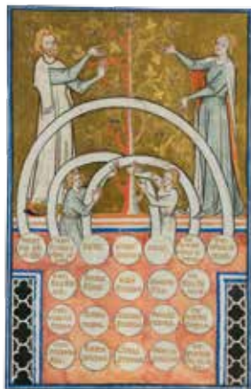
Grand Coutumier de Normandie, Normandie, vers 1350-1360, Paris, Petit Palais (détail)