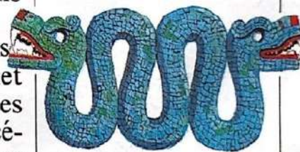
Quetzalcóatl, le dieu-serpent à plumes (mosaïque de turquoise)