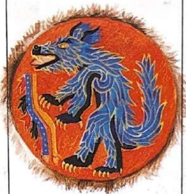
Mosaïque de plume