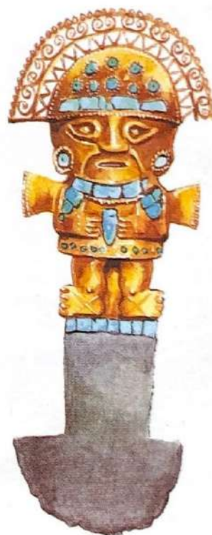
Couteau de sacrifice en or et turquoise (Art chimú, Pérou)

Les conquistadors gagnent les batailles grâce à leur armement et à leurs chevaux.