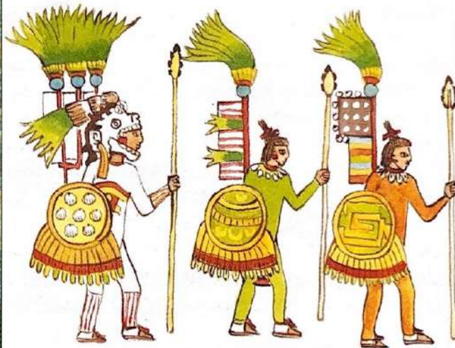
Guerriers aztèques (Codex Mendoza).

Ils ne sont que quelques milliers, assoiffés d'aventure, de conquête et d'or. Ils ne disposent que de faibles moyens : bateaux, chevaux et artillerie