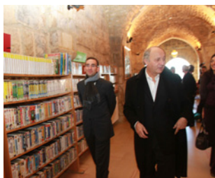
Visite du Ministre Laurent Fabius

► COOPERATION DECENTRALISEE Par sa connaissance fine du terrain et des acteurs locaux, l'IF-DEQ est un trait d'union efficace pour la mise en réseau des collectivités territoriales françaises et libanaises. Elle a déjà organisée des Rencontres en partenariat avec l'Institut d'Etudes Européennes et a reçu la visite de nombreux responsables politiques de part et d'autres de la Méditerranée.