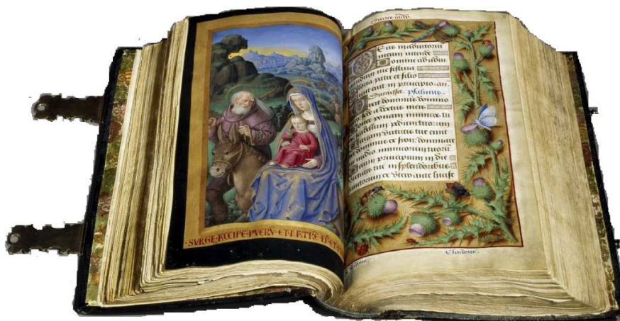
Grandes Heures d'Anne de Bretagne, enluminées par Jean Bourdichon (1503-1508). Peinture sur parchemin.

Le Bureau national de l'APL et de l'APHG