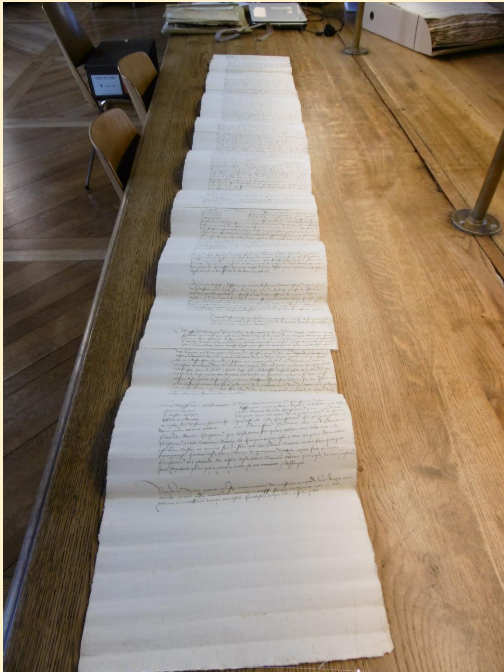
AD Côte d'Or, B 11882