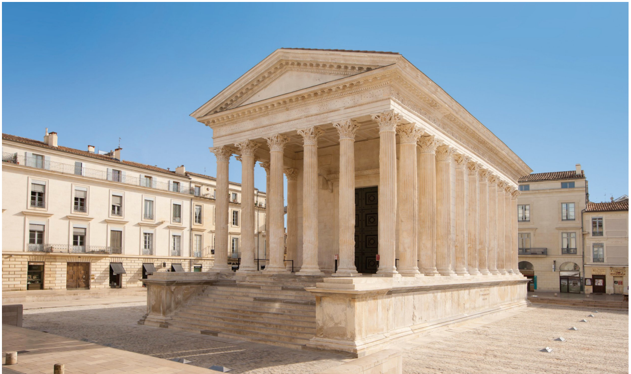
Maison Carrée, temple au culte impérial (Ville de Nîmes)