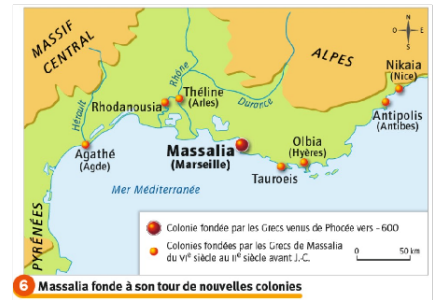
6 Massalia fonde à son tour de nouvelles colonies