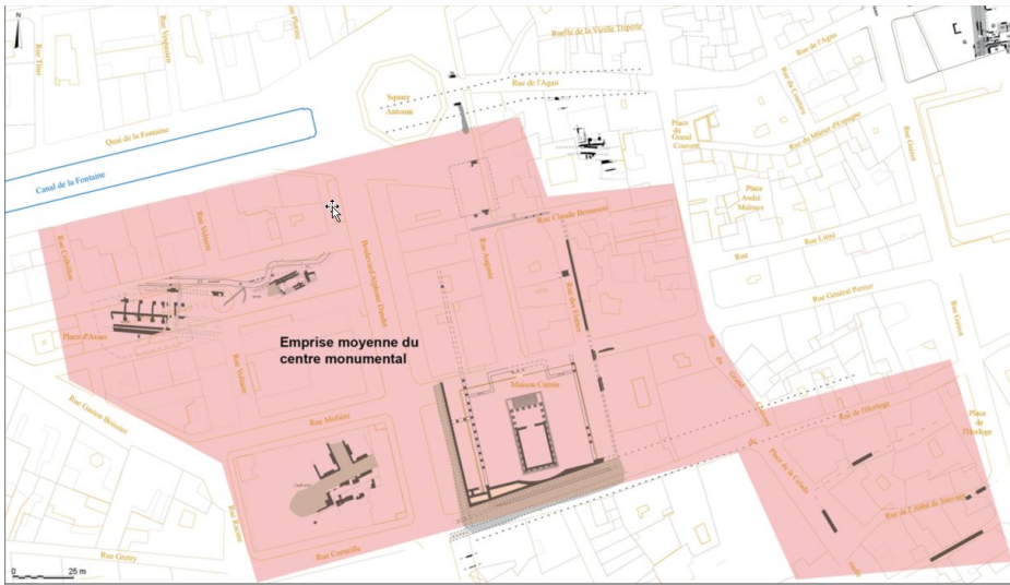
Emprise moyenne restituée du centre monumental en lien avec le forum © M. Célié, M. Monteil.