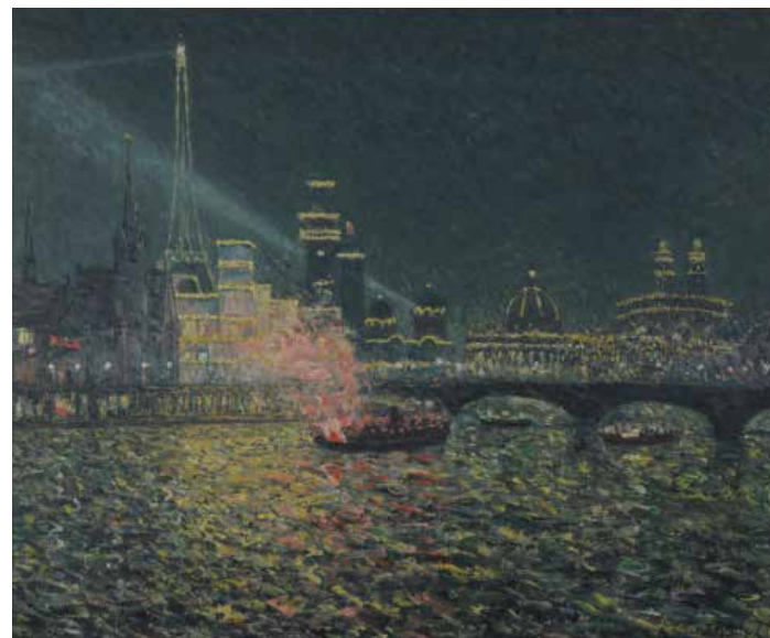
Maxime Maufra (1861-1918) Féerie nocturne , Exposition universelle, Paris, 1900, huile sur toile, 65,5 × 81,3 cm.

À l'aube du XX e siècle, Paris devient la Ville lumière. Le 14 avril 1900, avec l'inauguration de l'Exposition universelle, elle devient la capitale de la civilisation moderne. Le baron Haussmann perce de larges avenues, Gustave Eiffel élève sa tour... une époque rêvée pour les arts et les innovations techniques.