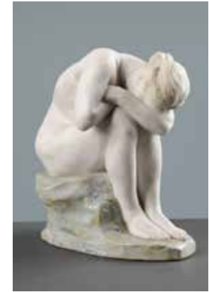
CHAMBRE DE MADAME

COLL. MUSÉE DES BEAUX-ARTS DE REIMS.