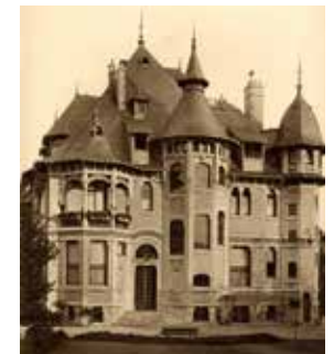
La Villa Cochet au début du siècle, avant qu'elle ne s'appelle la Villa Demoiselle.

2005-2009 Campagne de restauration d'après les archives et les documents conservés. La villa est baptisée "Demoiselle", du nom de la première cuvée "La Demoiselle" du champagne Vranken.