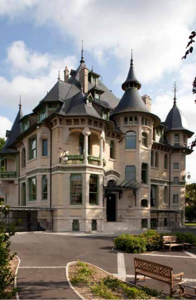
La Villa Demoiselle en 2009, après sa restauration.