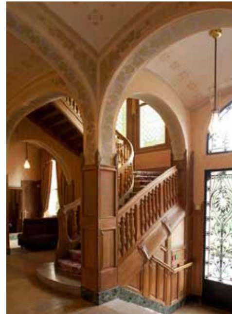
Hall de la Villa Demoiselle après restauration. Son escalier central est l'un des joyaux Art nouveau de la demeure.