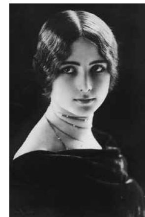
Portrait de Cléo de Mérode en 1902.

La danseuse Cléo de Mérode (1875-1966) incarne une beauté fantasmée et symboliste alors en vogue à l'époque de l'Art nouveau, tantôt angélique, tantôt diabolique. Le buste en marbre, sculpté par Alexandre Falguière en 1900, est l'un des plus beaux portraits de femme de la collection d'Henry Vasnier. Il rappelle également l'importance de Paris, Ville lumière, capitale de l'hédonisme et laboratoire international des arts. Les photographies de Cléo de Mérode par Paul Nadar furent à cette époque largement diffusées à l'échelle mondiale. « Chef-d'œuvre vivant », elle aurait été courtisée par les célébrités de l'époque, notamment le roi Léopold II de Belgique. Est-ce parce qu'elle avait été élue « reine de beauté » par les lecteurs de L'Illustration en 1896 que Vasnier acquiert aussitôt ce buste en 1900 ? Ou bien est-ce parce qu'elle symbolise, comme lui, la liberté affirmée et le mépris des bien-pensants ?