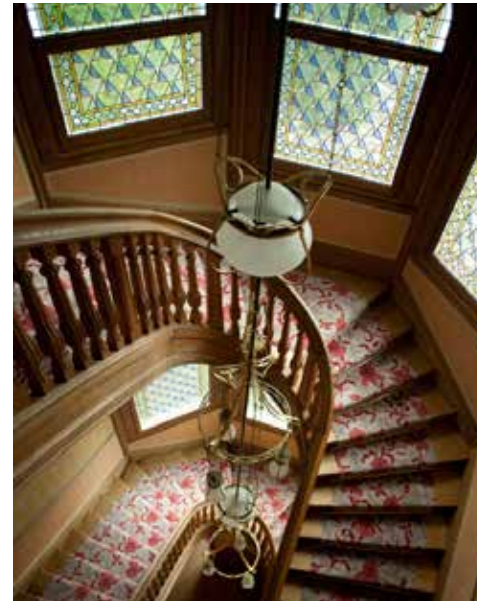
Le lustre à poulie et globes d'opaline de l'escalier de la Villa Demoiselle mesure pas moins de 10 mètres de haut et pèse près de 300 kilos.

Féerique, la Villa Demoiselle cache pourtant ses trésors. Si les références à l'Art nouveau (pomme de pin, libellule, iris, ombelles, globes d'opaline...) abondent, c'est dans le traitement de l'espace que s'affirme l'absolue modernité de l'ensemble. Rompant avec la conception de l'appartement haussmannien tout en pièces nobles et couloirs alignés sur cour, la Villa Demoiselle offre à ses occupants l'extravagance d'un espace libre. L'esprit "Sécession" affleure ainsi dans cette audace et l'on devine, au-delà, les prémices de ce qui animera bientôt l'esprit du Mouvement moderne. Reims est bien un carrefour, un incubateur des arts, et les passions y ont fleuri à l'ombre des villas en fleur. Philippe Trétiack