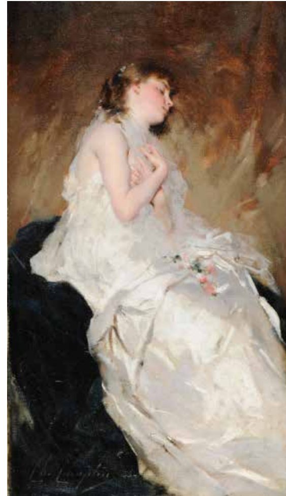
CHAMBRE DE MONSIEUR