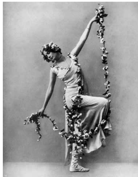
Cléo de Mérode dans La Danseuse de Pompéi de Jean Nougès, en 1912.