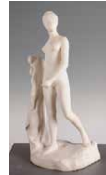
CHAMBRE DE MADAME

COLL. MUSÉE DES BEAUX-ARTS DE REIMS.