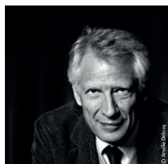
Dominique de Villepin