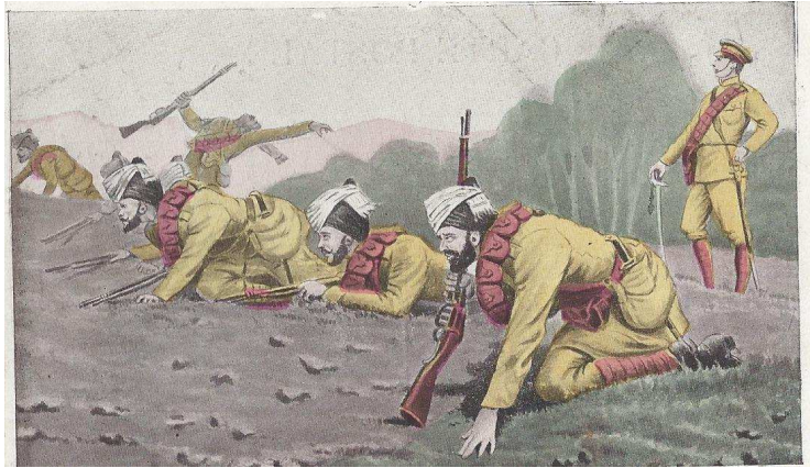
© Association Les Comptoirs de l'Inde

Outre la présentation du livre et/ou de l'exposition, l'association Les Comptoirs de l'Inde propose de faire connaître cette histoire sous la forme d'une conférence. Celle-ci s'adresse à tout public, et notamment au public scolaire, l'un des objectifs de l'association étant de sensibiliser les plus jeunes à cet aspect méconnu de l'histoire de la Première Guerre mondiale.