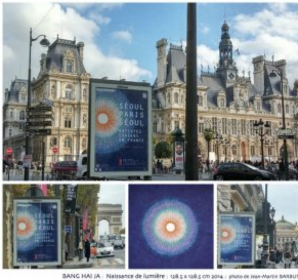
BANG HUI JA - Naissance de lumière - 128,5 x 128,5 cm 2014 - photo de Jean-Marie BARBUT

Le Musée Cernuschi présente une exposition consacrée aux artistes coréens contemporains ayant travaillé ou travaillant toujours en France. Soixante œuvres sont exposées.