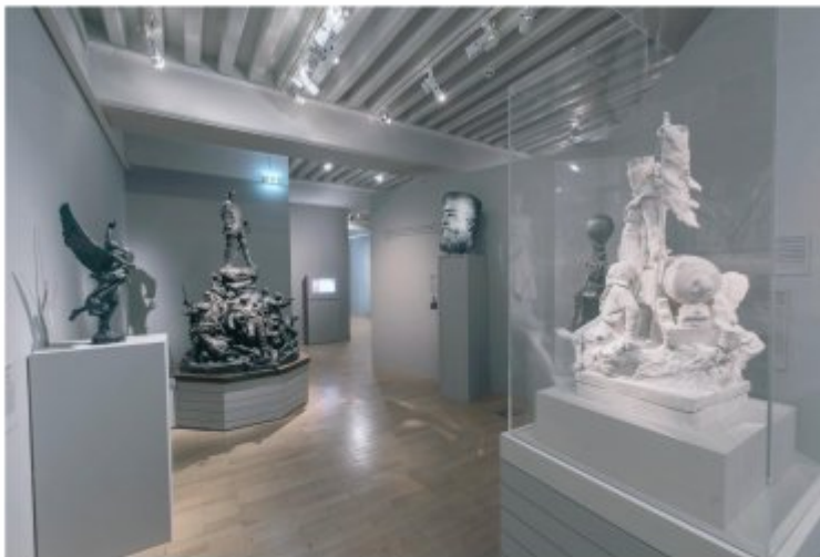
Vue de l'exposition France-Allemagne(s)

Cette rencontre se déroule dans l'auditorium Austerlitz du musée de l'Armée.