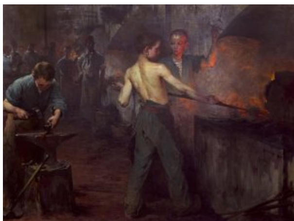
Jean Geoffroy, Ecole professionnelle à Dellys, travail du fer, 1899 - Musée national de l'Education - D 2016.2.1

Autre objet remarquable des collections du musée, le grand tableau de Jean Geoffroy intitulé Ecole professionnelle à Dellys , peint en 1899. Déposé par le Centre national des arts plastiques (CNAP), cette œuvre monumentale fait partie d'une commande de quatre scènes scolaires passée au « peintre de l'enfance » par le Ministère de l'Instruction publique et des Beaux-Arts en 1899 pour promouvoir l'école publique. Présentée à l'Exposition Universelle de 1900, elle figure un atelier de travail du métal à l'école professionnelle de Dellys , en Algérie. Cette œuvre témoigne du développement de l'enseignement technique, mais aussi de l'école en contexte colonial. Elle a ainsi tenu une place de choix dans l'exposition L'Algérie à l'école, l'école en Algérie présentée au musée en 2017/2018, qui explorait la relation franco-algérienne au travers du prisme de l'école de 1830 à nos jours.