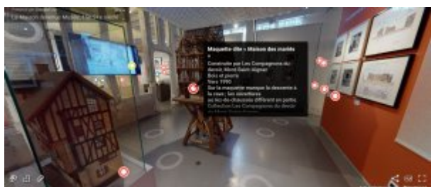
Visite virtuelle de l'exposition De la maison au musée présentée en 2019/2020 au Musée national de l'Education, 2020

Parallèlement, le musée a mis en place dès le printemps 2020 une collecte participative destinée à documenter dans ses collections la situation éducative et scolaire inédite suscitée par le premier confinement. Cette collecte Education confinée , menée avec le soutien du Mucem (qui a mis en place une démarche similaire ), sollicite l'expérience de chacun : enseignants, parents, élèves, membres de la communauté éducative au sens large. Ce travail a déjà permis de recueillir de nombreux témoignages des pratiques éducatives mises en œuvre, et a notamment mis en lumière l'importance des productions numériques générées pendant cette période, ouvrant pour le musée un défi patrimonial complexe et stimulant.