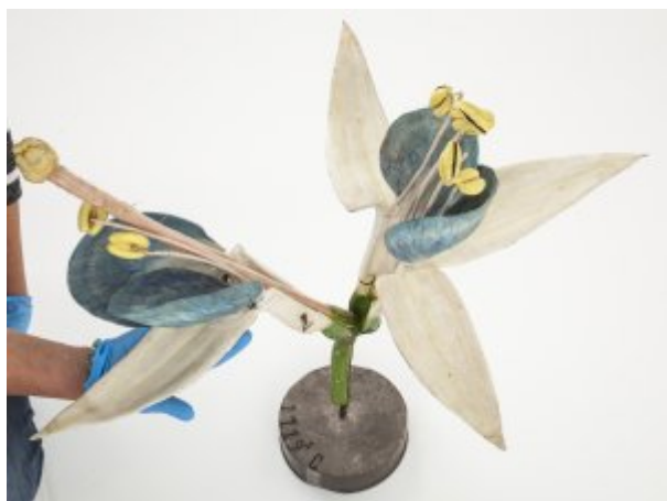
Etablissements Auzoux, Modèle de fuchsia, 1877 - Musée national de l'Éducation - 2009.00532