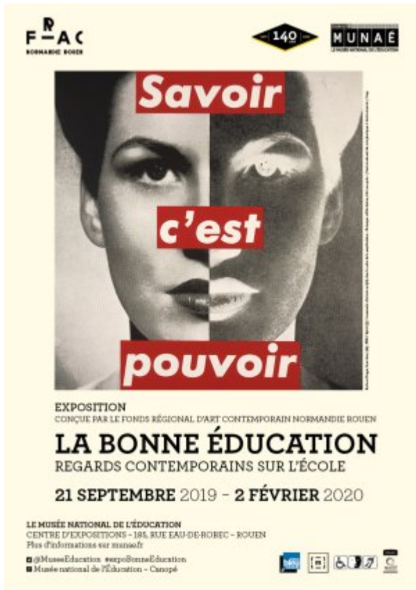
Affiche de l'exposition La bonne Éducation : regards contemporains sur l'école (2019 - 2020), 2019