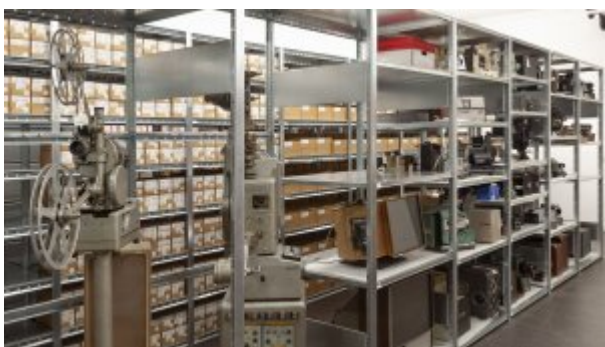
Centre de ressources du Musée national de l'Éducation : réserve dédiée au matériel de projection.

Le Musée national de l'Éducation conserve aujourd'hui une collection riche de près 950 000 objets et documents relatifs à l'histoire de l'éducation au sens large du XVI e siècle à nos jours, en France et dans ses anciennes colonies. Les collections se répartissent en plusieurs grandes typologies , parmi lesquelles le matériel didactique, le mobilier scolaire, les jeux et jouets, les représentations figurées (notamment les tableaux et estampes), les travaux d'élèves, les manuels scolaires, les archives enseignantes ou encore un fonds photographique de première importance. Une part significative des collections est numérisée et désormais consultable par tous sur une base de données en ligne . Musée d'histoire mais aussi de société, le Musée national de l'Éducation aborde les questions contemporaines à travers une perspective historique. Fidèle à la volonté des créateurs du Musée Pédagogique, il continue ainsi de jouer un rôle majeur au service de la communauté éducative.