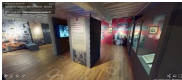
Visite virtuelle de l'exposition Métier d'enseignant(e), métier d'élève présentée en 2020/2021 au Musée national de l'Education, 2020

par une troisième page consacrée aux métiers du musée. La mise en place de visites virtuelles des expositions La maison devenue musée et Métier d'enseignant(e), métier d'élève ont par ailleurs permis de pallier à l'impossibilité de se rendre dans les lieux tout en préservant l'expérience sensible de la visite et de la déambulation dans un espace scénographié. Enfin, le musée a largement exploité les possibilités offertes par les réseaux sociaux, notamment par le biais de ses comptes Facebook (@museenationaldeleducation) et Twitter (@MuseeEducation).