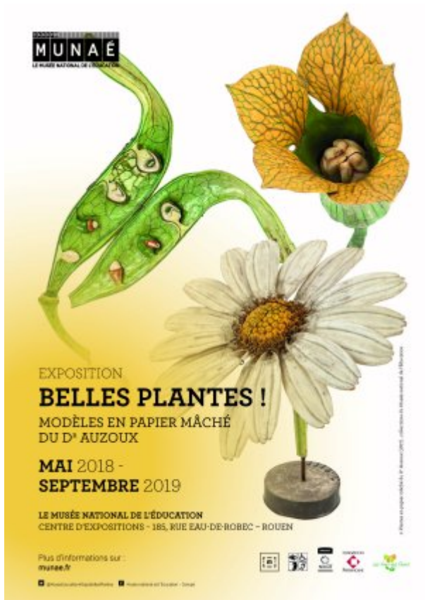
Affiche de l'exposition Belles plantes ! Modèles en papier-mâché du D' Auzoux (2018- 2019), 2018

En 2021, le public pourra découvrir l'exposition grand format Métier d'enseignant(e), métier d'élève (16 octobre 2020 - 5 septembre 2021), qui revient sur les enjeux passés et actuels du métier d'enseignant (e) et du métier d'élève dans une perspective socio-historique. L'année sera par ailleurs rythmée par trois expositions dossier : Les enfants de la Résistance, en partenariat avec les éditions du Lombard et en lien avec la série d' albums du même nom (du 3 février au 6 juin 2021) ; L'élève Flaubert : nous étions à l'étude... dans le cadre des célébrations nationales du bicentenaire de l'auteur de Madame Bovary (du 3 juillet au 31 octobre 2021) ; Enseigner la Seconde Guerre mondiale (à partir de novembre 2021).