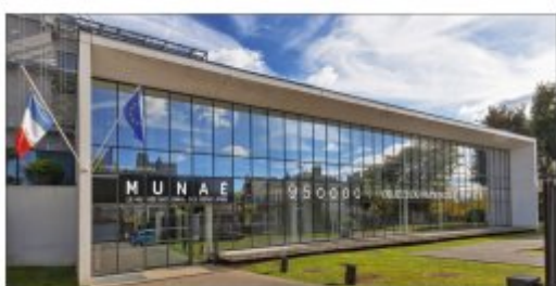
Entrée du centre de ressources du Musée national de l'Éducation

Le Musée national de l'Éducation conserve aujourd'hui une collection riche de près 950 000 objets et documents relatifs à l'histoire de l'éducation au sens large du XVI e siècle à nos jours, en France et dans ses anciennes colonies. Les collections se répartissent en plusieurs grandes typologies , parmi lesquelles le matériel didactique, le mobilier scolaire, les jeux et jouets, les représentations figurées (notamment les tableaux et estampes), les travaux d'élèves, les manuels scolaires, les archives enseignantes ou encore un fonds photographique de première importance. Une part significative des collections est numérisée et désormais consultable par tous sur une base de données en ligne . Musée d'histoire mais aussi de société, le Musée national de l'Éducation aborde les questions contemporaines à travers une perspective historique. Fidèle à la volonté des créateurs du Musée Pédagogique, il continue ainsi de jouer un rôle majeur au service de la communauté éducative.