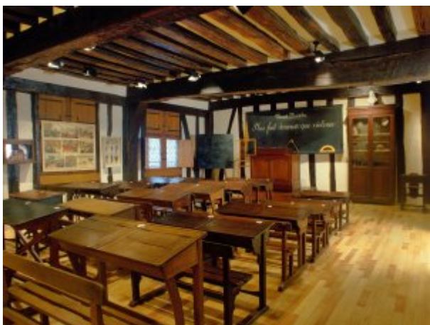
Centre d'exposition du Musée national de l'Éducation : la salle de classe dite Jules Ferry, à l'intérieur de la Maison des Quatre Fils Aymon