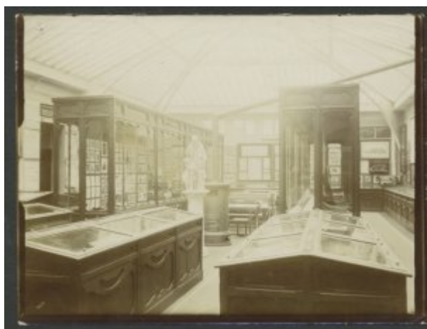
Salle du Musée Pédagogique vers 1900

Le Musée national de l'Education est l'héritier du Musée Pédagogique créé en 1879 à Paris par Jules Ferry, alors ministre de l'Instruction publique et des Beaux-Arts, et Ferdinand Buisson, directeur de l'Enseignement primaire. Cette création s'inscrit dans un vaste mouvement d'émulation internationale, qui voit dans la seconde moitié du XIX e siècle fleurir ce type d'institutions dans plusieurs pays [2]. Contemporain du Dictionnaire de pédagogie dirigé par Ferdinand Buisson, il s'intègre par ailleurs dans un processus plus large de refonte de l'école. Il se présente alors avant tout comme un lieu de ressources pédagogiques, sur un modèle qui n'est pas sans rappeler celui du Musée des arts et métiers. Une bibliothèque centrale lui est d'ailleurs adjointe.