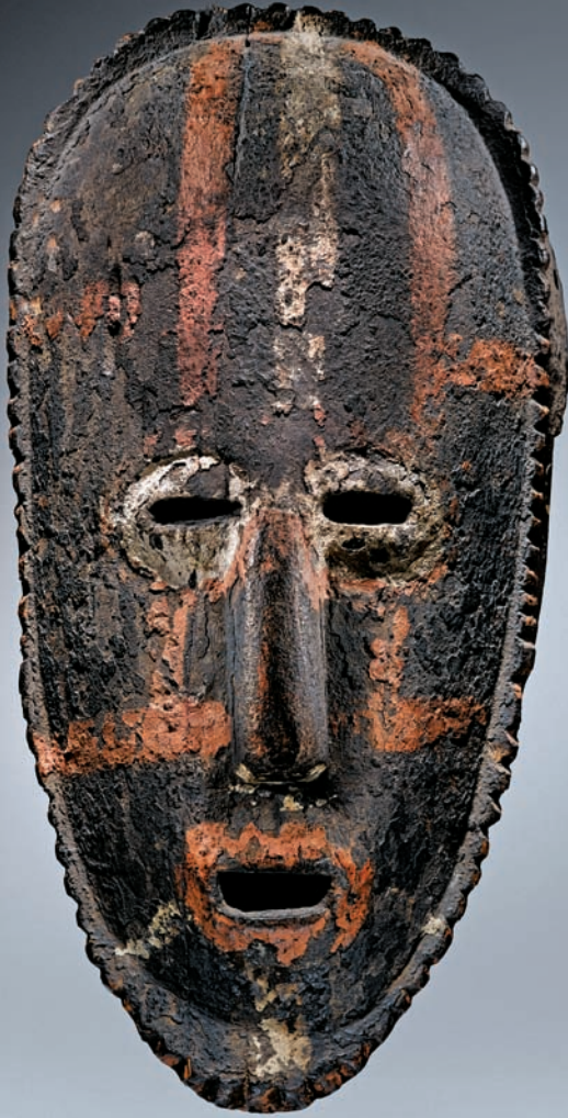
MASQUE ATTIIÉ. CÔTE D'IVOIRE. BOIS POLYCHROME. XIX e SIÈCLE.

On ne connaît que trois masques attribués aux attié : l'un d'entre eux, autrefois dans la collection Paul Tishman, est aujourd'hui conservé au National Museum of African Art de Washington. Ce masque représente une acquisition majeure pour les collections du musée du quai Branly. Il trouvera une place de référence dans les collections permanentes en renforçant la représentation et la diversité des arts de la Côte d'Ivoire.